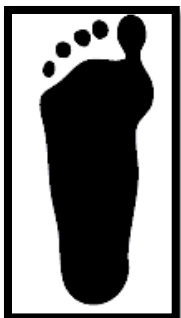
Pied plat : stade 2