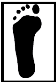
Pied plat : stade 1