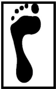
Empreinte plantaire normale